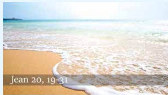
Jean 20, 19-31

C'était après la mort de Jésus. Le soir venu, en ce premier jour de la semaine, alors que les portes du lieu où se trouvaient les disciples étaient verrouillées par crainte des Juifs, Jésus vint, et il était là au milieu d'eux. Il leur dit : "La paix soit avec vous !" Après cette parole, il leur montra ses mains et son côté. Les disciples furent remplis de joie en voyant le Seigneur. Jésus leur dit de nouveau : "La paix soit avec vous ! De même que le Père m'a envoyé, moi aussi, je vous envoie." Ayant ainsi parlé, il souffla sur